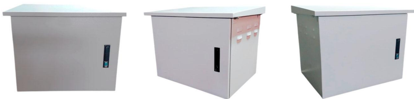
Gabinete para Exteriores 18RU (Vista Frontal)

Gabinete para Exteriores 18RU (55 x 45 x 82 cm)