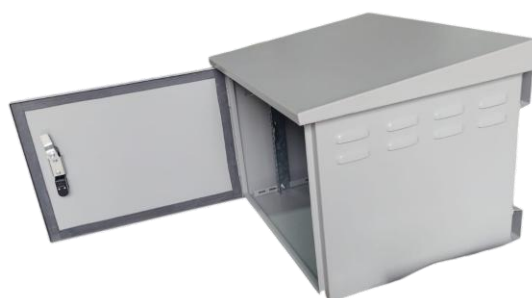
Gabinete para Exteriores 18RU (Vista Lateral)